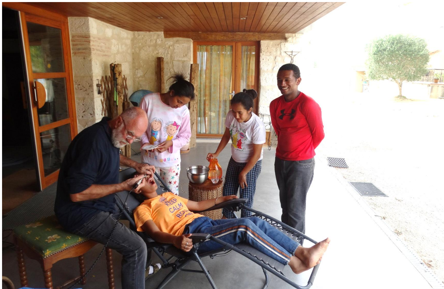
Soins dentaires sur un transat à l'entrée de la Grange de Piac

Lors de mon 1 er passage, certains d'entre eux se plaignaient de douleurs dentaires ; mais impossible de trouver un dentiste en plein mois d'août. Alors lors de mon 2 ème passage j'ai apporté mon matériel dentaire portatif avec lequel j'ai pu leur faire des détartrages, des obturations, des traitements canalaires, des extractions et... même un implant !