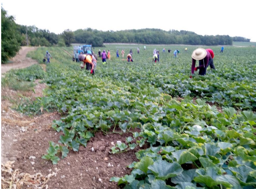
Récolte des melons

Le véhicule 9 places fourni par la Sté Boyer (Philibon) leur est bien utile pour tous leurs déplacements, d'autant que le carburant est également fourni par la société.